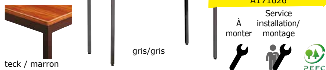
Table polyvalente Manutan - Largeur 70 cm

Utilisez cette belle et robuste table pour tout type de réunion, comme table de buffet ou comme desserte